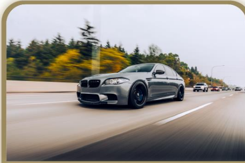
El automóvil/el coche /el carro